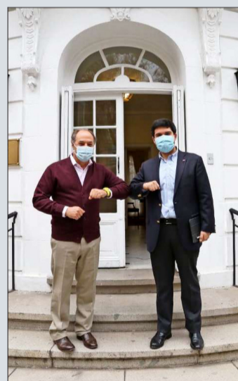
El presidente de la CPC, Juan Sutil, y el ministro Julio Isamit.

El ministro de Bienes Nacionales, Julio Isamit, se reunió con el presidente de la Confederación de la Producción y del Comercio (CPC), Juan Sutil, para presentar el plan de licitaciones del ministerio y el nuevo Visor Territorial con información georreferencial de los inmuebles fiscales a licitar.