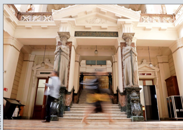
En enero el TDLC condenó por colusión a Sanderson y Baxter.

La generadora Colbún entregó ayer certificados de balance de energía renovable a sus clientes, mediante los cuales acredita que aquellas empresas cuentan con un abastecimiento de energía 100% renovable, en una ceremonia que se realizó de manera virtual. En total, los 46 clientes que recibieron esta certificación significaron un consumo de energía renovable de 690.192 MWh durante 2019, datos que fueron verificados por la empresa EY Chile. Este volumen de energía renovable certificada permitió evitar la emisión de 350 mil toneladas de CO 2 , lo cual equivale a retirar de circulación por un año el equivalente a 87.500 automóviles.